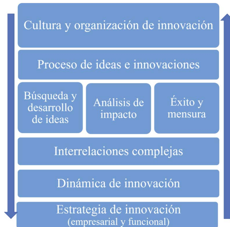
Esquema 1: Interacciones complejas de la gestión de ideas e innovaciones 172

La pregunta directriz para las empresas y su gestión de innovaciones es cómo dirigir la creciente complejidad y en cuál sector es necesario impulsar un cambio activamente. 171 Si entonces la estrategia empresarial como base incluye innovaciones y se promueve la dinámica de innovaciones siempre analizando las complejas interacciones entre la generación de ideas y su desarrollo, su impacto y la mensura de su éxito a lo largo de todo el proceso, se genera una organización y cultura orientada a las innovaciones. Sin embargo el mero hecho de que exista un sistema de regla no asegura el éxito. Más bien es necesario asegurar que se germinan libremente las componentes coordinadas por la gestión. Aparte no se debe dejar de consolidar la base de conocimiento y continuamente adaptarse a las condiciones cambiantes.