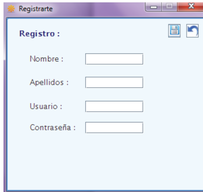
Figura 8.2 Captura de pantalla 'Registrar usuario'

Esta ventana muestra el registro de un usuario, si no está registrado tiene la opción de crear un nuevo usuario.