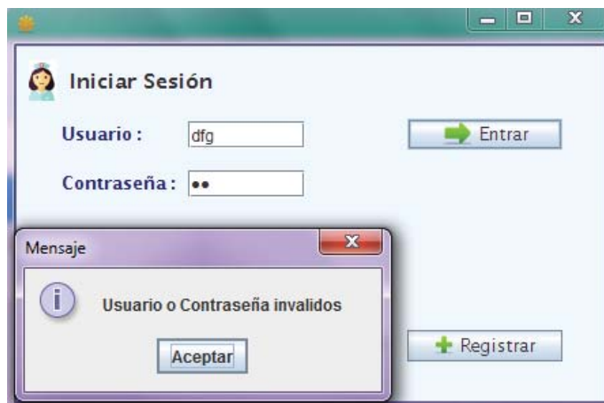
Figura 8.3 Captura de pantalla 'Usuario incorrecto'

En esta ventana se muestra el acceso al sitio principal, pero con un usuario incorrecto. Se mostrara un mensaje de error y se volverá a pedir usuario y contraseña.