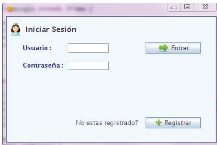
Figura 8.1 Captura de pantalla 'Acceder sitio principal'

En esta ventana se muestra el acceso al sitio principal, en donde pide un usuario y una contraseña, estos están guardados en un archivo XML.