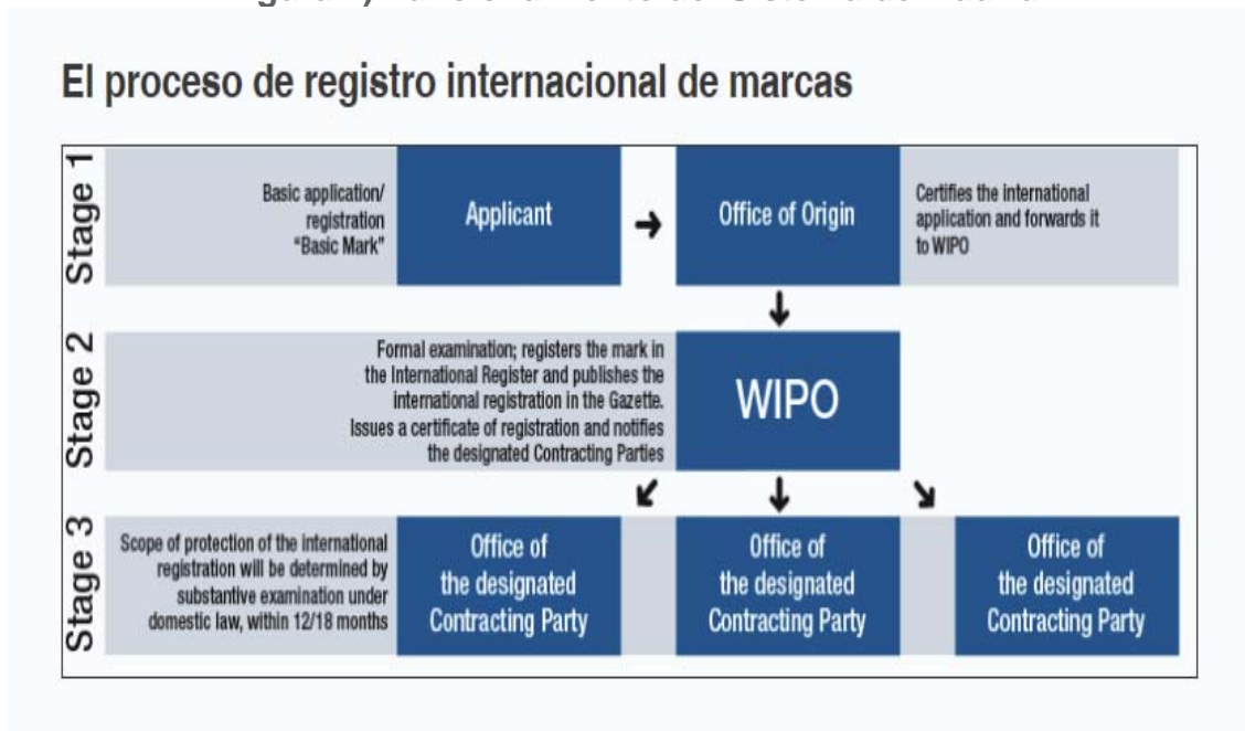
Figura 2) Funcionamiento del Sistema de Madrid

Tal como se observa en el diagrama anterior, el Sistema de Madrid consta de tres etapas para el registro internacional de marcas: